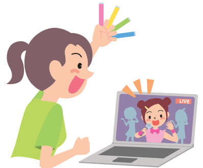
ขอให้พิจารณาเข้าร่วมงานอีเว้นท์ผ่านทางออนไลน์ ฯลฯ ตามความจำเป็น

• โดยเฉพาะอย่างยิ่ง สำหรับผู้สูงอายุ ผู้มีโรคประจำตัวที่กำหนด และผู้ใกล้ชิดกับบุคคลดังกล่าวเป็นประจำ ขอให้หลีกเลี่ยงการเข้าร่วมงานอีเว้นท์หรือร่วมงานรับประทานอาหารในสภาพแวดล้อมที่จะเกิดสถานที่อับอากาศ สถานที่แออัดที่มีผู้คนคับคั่ง สถานการณ์ที่มีการสัมผัสใกล้ชิดได้ง่าย และไม่ได้มีการเตรียมมาตรการป้องกันการติดเชื้อแบบพื้นฐานอย่างเคร่งครัด