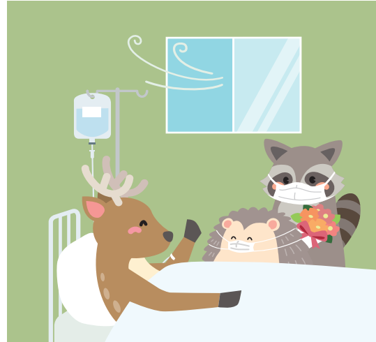
基礎疾患のある方など 重症化リスクの高い方への配慮を。