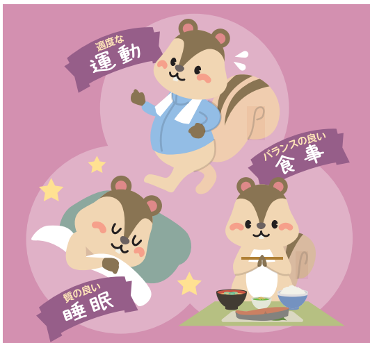
普段から体調管理をしっかりと。