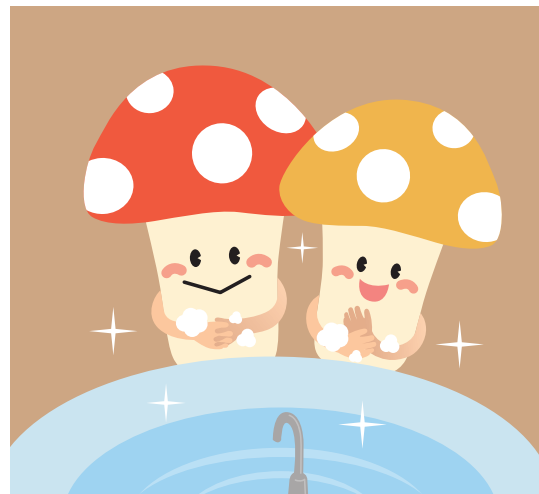
手洗い・手指消毒は、 指先や手首なども意識して丁寧に。