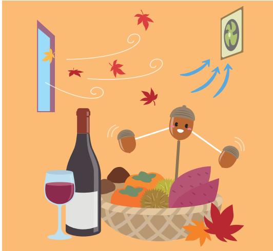
換気は、換気扇や窓開けなどを利用して効果的に。