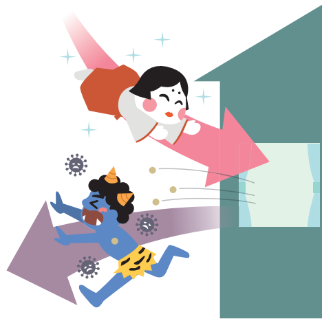
部屋の換気をしよう