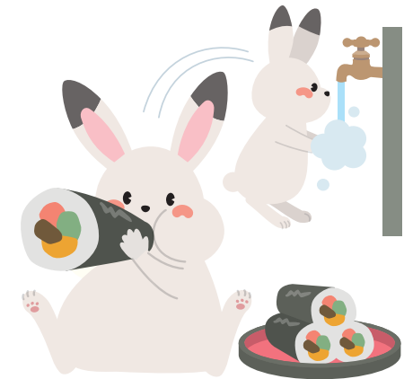
こまめに手を洗おう