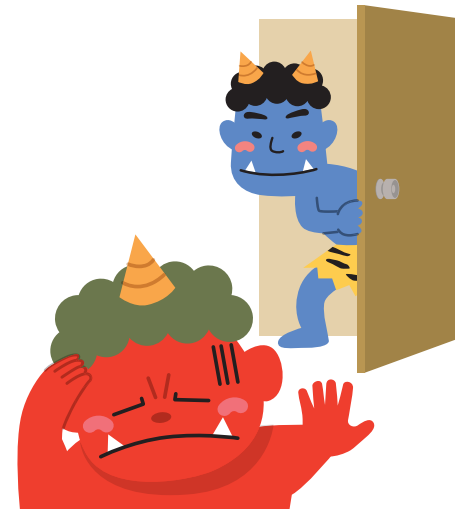
体調の変化を確認しよう