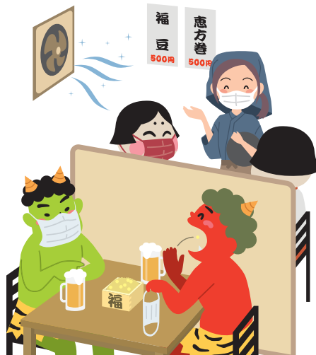
感染対策をして飲食を楽しもう