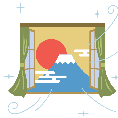
空気のいれかえをしよう