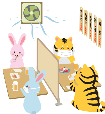
感染対策をして飲食を楽しもう