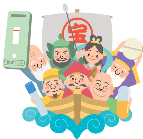
発熱にそなえた準備をしよう