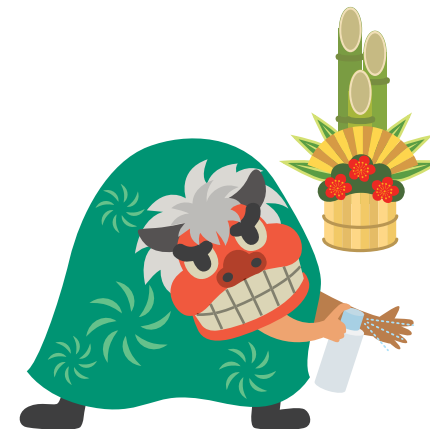
外出先でも手洗い・手指の消毒をしよう