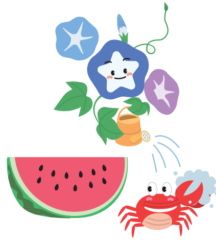
食事の前は手を洗おう