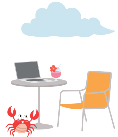
テレワークや時差出勤をしよう