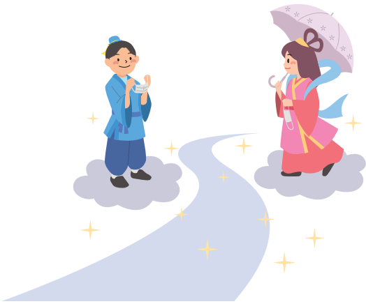
熱中症に気をつけながら感染対策をしよう