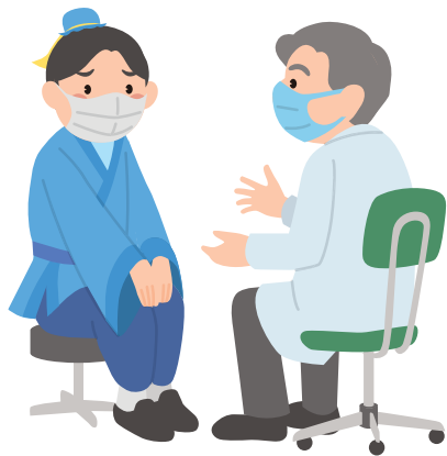
体調が悪いときは受診や検査をしよう