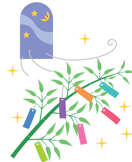
部屋の換気をしよう